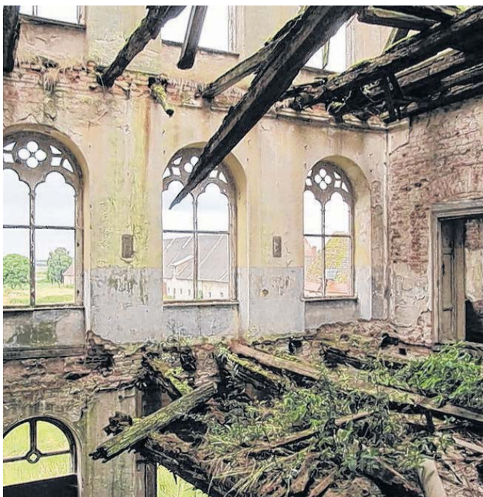
Einst tanzten hier die Herrschaften und so sieht der Saal im Schloss Broock heute aus.