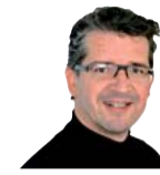
Ganz nebenbei von Jürgen Mladek