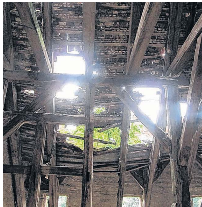
Wenn sich nicht schnell ein Investor findet, wird der marode Dachstuhl wohl komplett einstürzen.